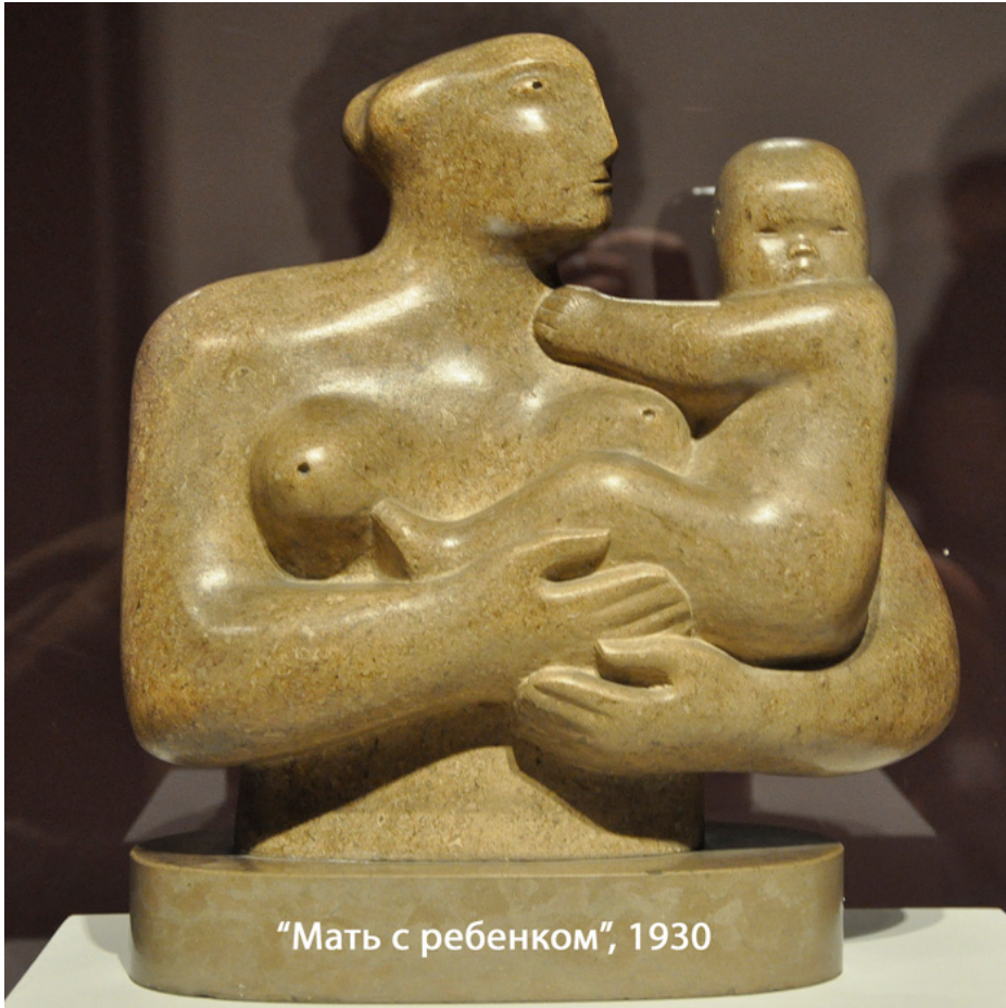
«Мать с ребенком», 1930

себя, утрачивает былую оригинальность. В его послевоенных работах прослеживается глубокая озабоченность судьбами мира после пережитого им в двух войнах, разрушения Хиросимы, Холокоста, в обстановке Холодной войны. Работы этого времени – фигуры воинов на основе древнегреческих образцов – «Воин со щитом» (1954), «Падающий воин» (1956-7), «Рабочая модель атомной энергии» (1964-5) –