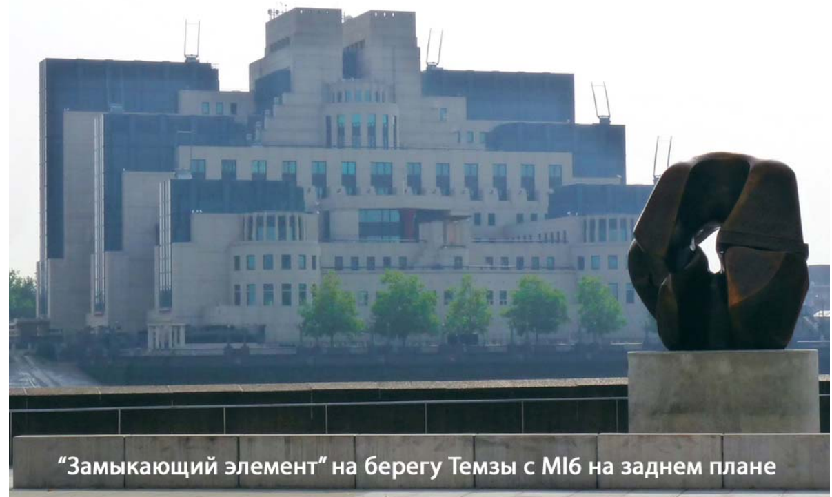
“Замыкающий элемент” на берегу Темзы с М16 на заднем плане

Новая выставка никак не ретроспективная, она заново оценивает роль Мура в искусстве, его влияние на развитие так называемой прогрессивной скульптуры, сюрреализма и абстракционизма, знакомит с некоторыми малоизвестными сторонами его творчества и жизни: такими, как эротизм, клаустрофобия и мрачная тревога. Мур, видимо, был коммунистом, хотя документальных свидетельств не сохранилось, а также активным борцом за ядерное разоружение. На выставке представлено 150 ключевых работ скульптора из камня, дерева, бронзы, его знаменитые чёрно-белые рисунки времен Второй мировой войны.