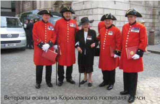
Ветераны войны из Королевского госпиталя Челси