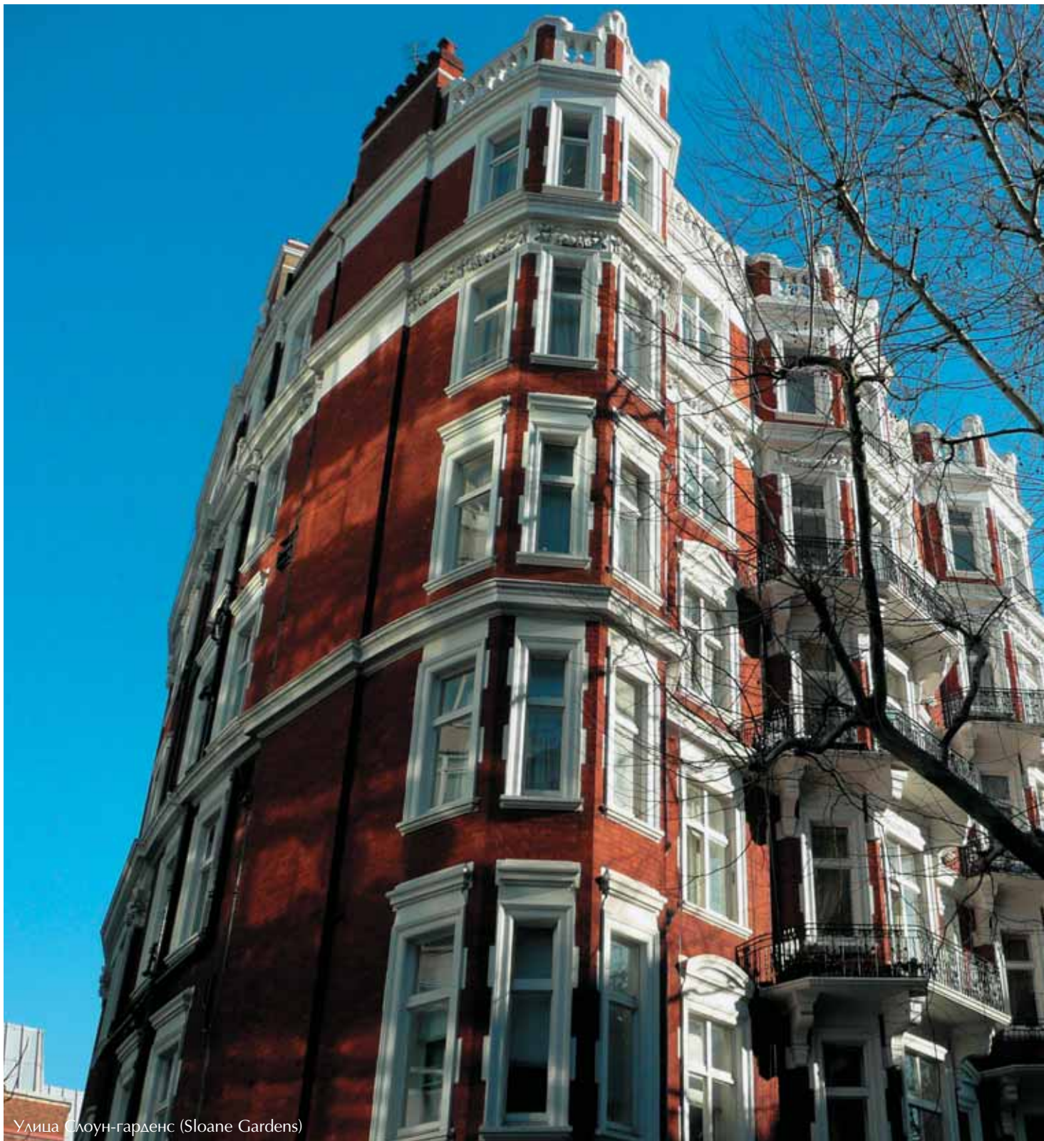
Улица Слоун-гартенс (Sloane Gardens)