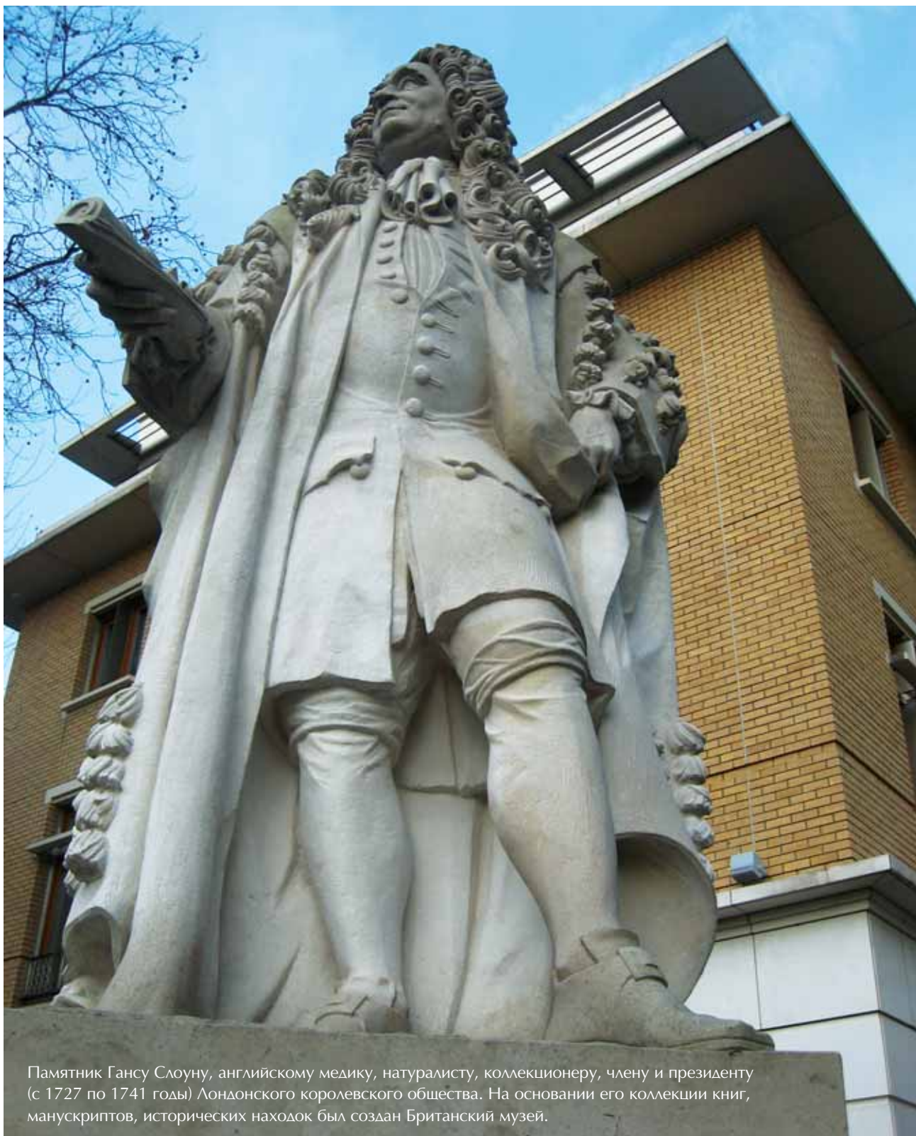
Памятник Гансу Слоуну, английскому медику, натуралисту, коллекционеру, члену и президенту (с 1727 по 1741 годы) Лондонского королевского общества. На основании его коллекции книг, манускриптов, исторических находок был создан Британский музей.