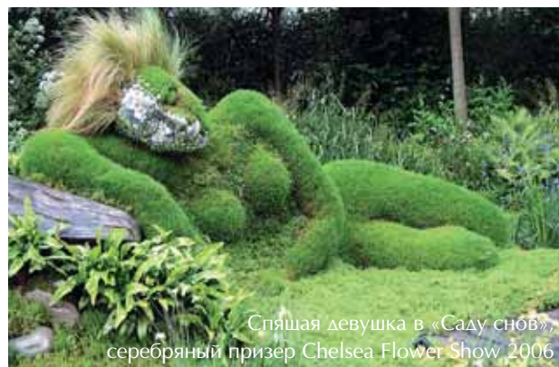
Спящая девушка в «Саду снов», серебряный призёр Chelsea Flower Show 2006