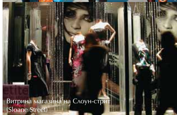
Витрина магазина на Слоун-стрит (Sloane Street)