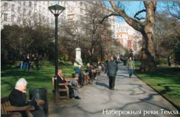
Набережная реки Темза

В оживленном и пропитанном городским духом юго-западном квартале Лондона Челси трудно различить признаки деревушки на берегу Темзы, стоявшей здесь несколько сот лет назад, трудно увидеть черты колонии лондонской интеллектуальной богемы XIX века или признаки эпицентра лондонской моды 60-х годов прошлого века. Сегодня же к челсийской смеси прибавляется и еще одна составляющая: с тех пор как россиянин Роман Абрамович приобрел в июле 2003 года клуб «Челси» вместе с расположенным на краю Челси стадионом Стэмфорд-бридж, в этом квартале стали один за другим покупать недвижимость другие свободные в средствах россияне, и недалек тот день, когда Челси станет русским кварталом города, «Москвой на Темзе». На русско-лондонском сленге главная площадь квартала Слоунсквер и отходящая от нее улица дорогих магазинов женской одежды Слоун-стрит уже зовутся «слоновыми», хотя имеют отношение не к слонам, а к Гансу Слоуну, чья загородная усадьба стояла в XVIII веке в этих местах, основателю Британского музея и изобретателю молочного шоколада.