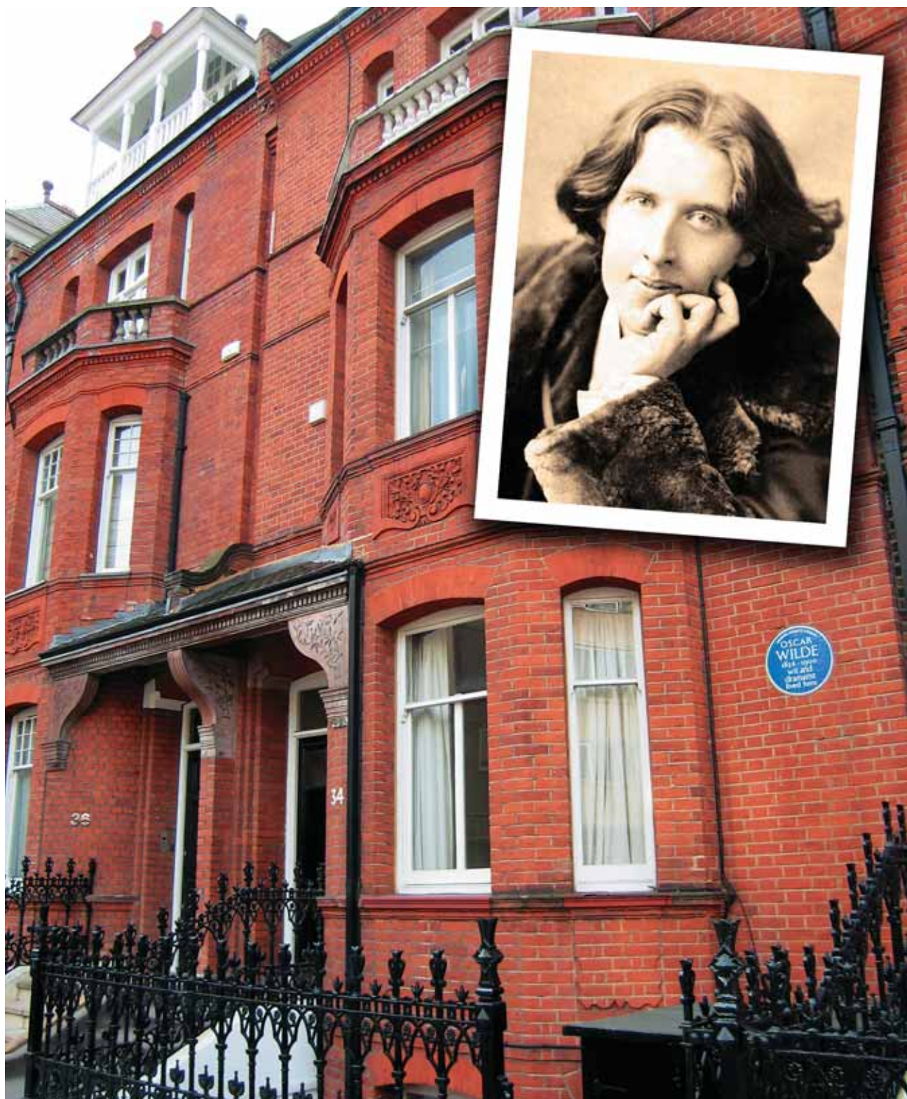
Дом №34 на улице Тайт-стрит, в котором с 1884 по 1895г.г. жил известный английский писатель Оскар Уайлд