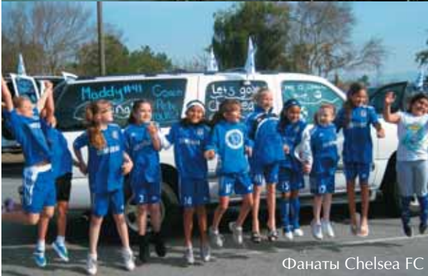
Фанаты Chelsea FC